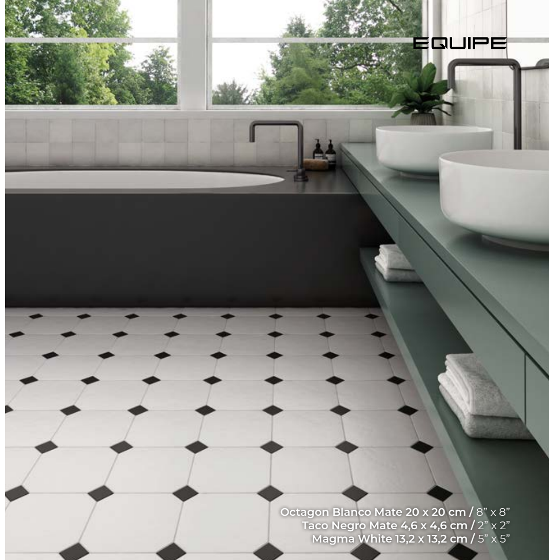
Octagon Blanco Mate 20 x 20 cm / 8" x 8" Taco Negro Mate 4,6 x 4,6 cm / 2" x 2" Magma White 13,2 x 13,2 cm / 5" x 5"