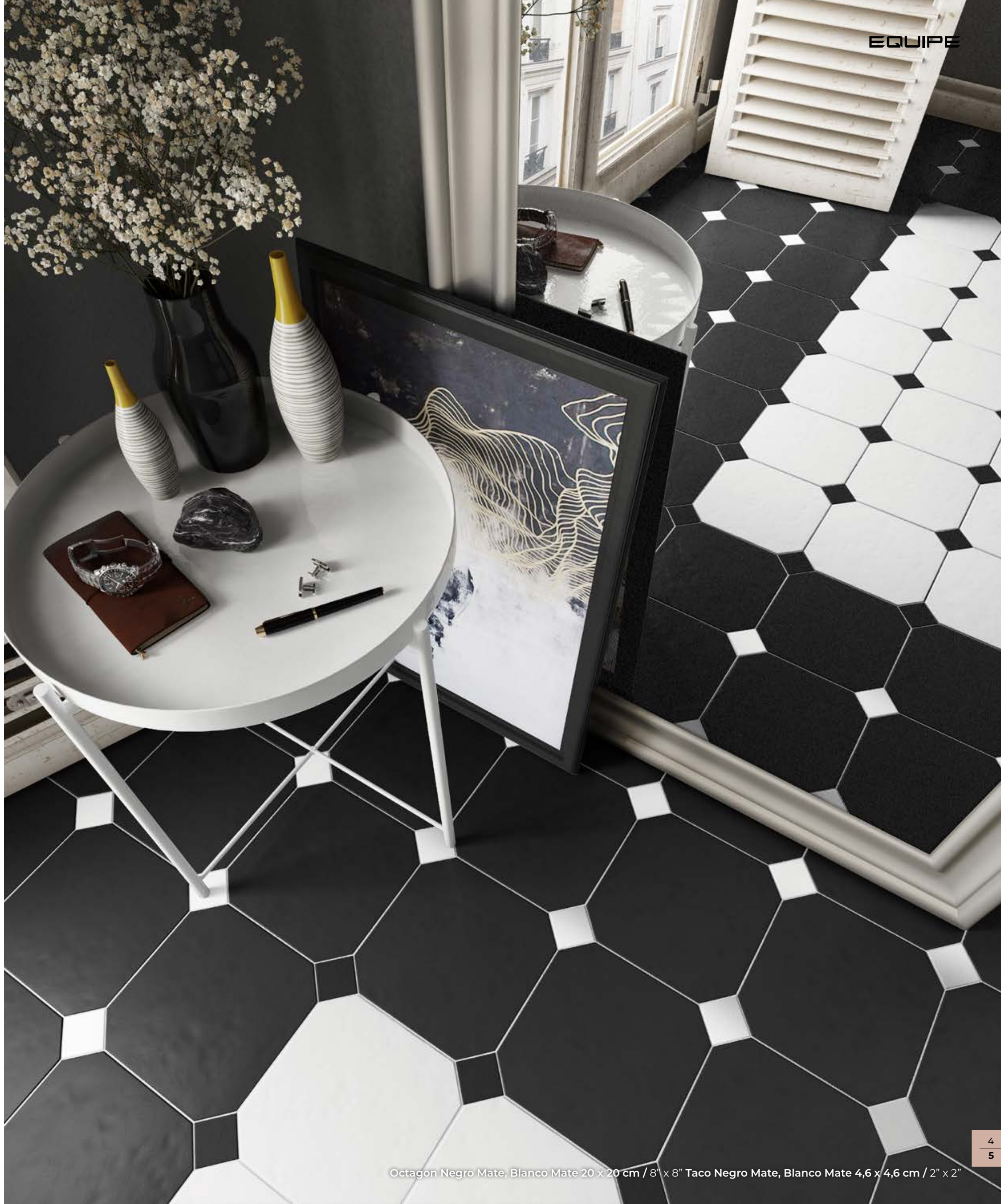
Octagon Negro Mate, Blanco Mate 20 x 20 cm / 8" x 8" Taco Negro Mate, Blanco Mate 4,6 x 4,6 cm / 2" x 2"