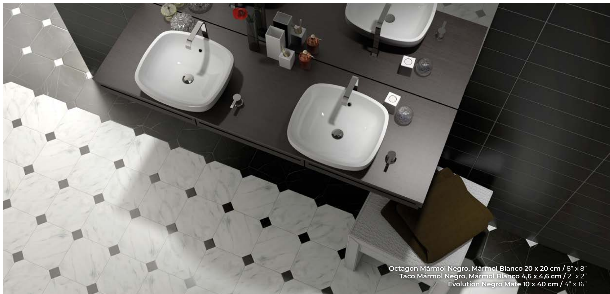
Octagon Mármol Negro, Mármol Blanco 20 x 20 cm / 8" x 8" Taco Mármol Negro, Mármol Blanco 4,6 x 4,6 cm / 2" x 2" Evolution Negro Mate 10 x 40 cm / 4" x 16"