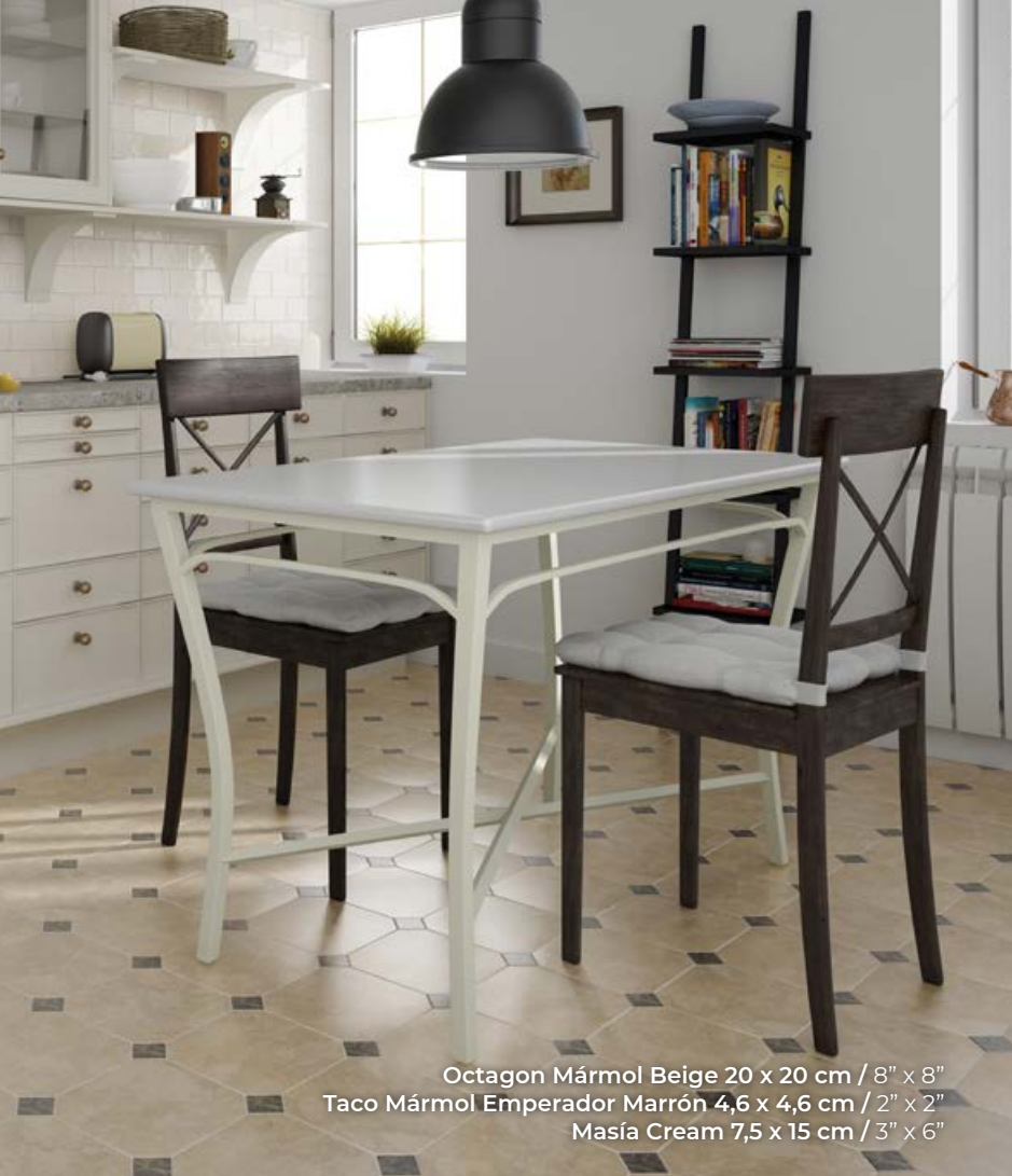
Octagon Mármol Beige 20 x 20 cm / 8" x 8" Taco Mármol Emperador Marrón 4,6 x 4,6 cm / 2" x 2" Masía Cream 7,5 x 15 cm / 3" x 6"